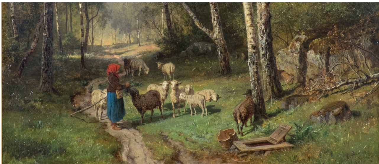
"Betande får" av Edvard Bergh, 1873.